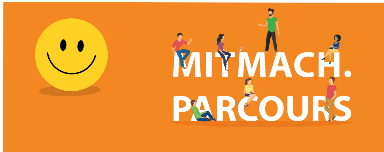
Beliebtes Highlight der CULT – auch in diesem Jahr mit vielen Teilnehmern: Der Mitmach.Parcours

Und so geht's: An den mit Smiley gekennzeichneten Ständen gibt es die Möglichkeit aktiv zu sein. Für die Absolvierung der Aufgaben gibt es einen Stempel bzw einen QR-Code, je nachdem ob die Besucherin/ der Besucher mit dem Messe.Magazin oder der CULT Messe.App unterwegs ist. Was es alles auszuprobieren und zu erleben gibt, zeigt der „Spielplan“ auf der rechten Seite.